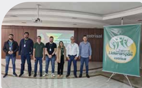
Teve início em maio, nova turma do Programa de Lideranças da Cotrisal. O trabalho faz parte do projeto de desenvolvimento estratégico da cooperativa.