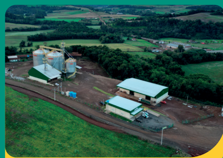
São José do Inhacorá